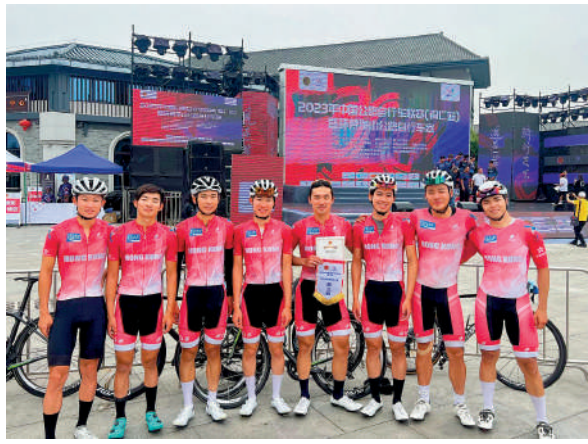
▲香港隊在男子團體計時賽獲得亞軍。

【大公報訊】記者黃智佳報道：2023年中國公路單車聯賽（銅仁站）上周五起，一連4日上演。香港在首3天比賽日日贏牌，先後在男子團體計時賽、個人計時賽、男子和女子城市繞圈淘汰賽共奪2銀2銅，在月底香港國際場地盃前展示不俗的狀態。