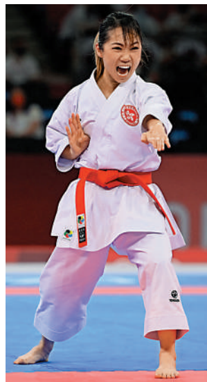
▲香港空手道名將劉慕裳。

未能報卻開羅站一敗之仇，劉慕裳自從2018年K1超聯摩洛哥站摘金後，身陷5年冠軍荒。不過，她自2020年起連續14項國際賽都贏得獎牌，表現穩定性可見一斑。