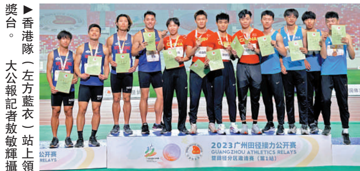
▲香港隊（左方藍衣）站上領獎台。

申請新酒牌公告 小銅霸 現特通告：蘇銳其地址為香港銅鑼灣謝斐道535號TOWER 535地庫B03號舖，現向酒牌局申請位於香港銅鑼灣謝斐道535號TOWER 535地庫B03號舖小銅霸的新酒牌。凡反對是項申請者，請於此公告刊登之日起十四天內，將已簽署及申明理由之反對書，寄交香港灣仔軒尼詩道225號路政道市政大廈8樓酒牌局秘書收。 日期：2023年5月15日