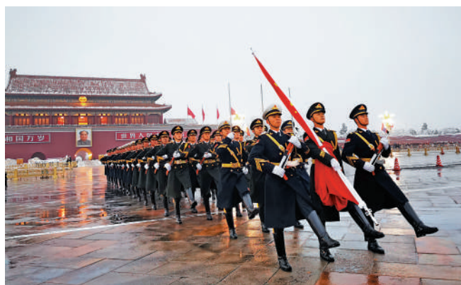
▲戰士們在冬日裏冒着雨雪進行升旗儀式。