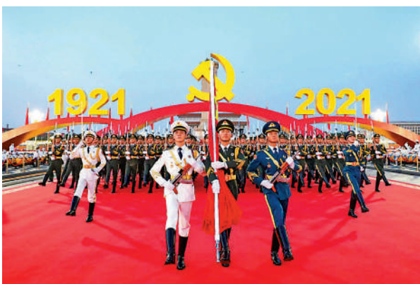
▲中國共產黨成立100周年慶祝大會上舉行的升旗儀式。