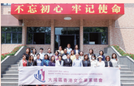
▲訪問團在斗門區政府前與當地領導及嘉賓合影。