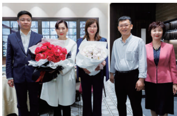
▲左起：珠海市副市長李翀，港區全國人大代表鄭美雲，總會創會主席謝景霞，珠海市委常委、香洲區委書記李偉輝及香洲區委常委、統戰部部長陳祥瑞合影。

另外，一眾女企業家還參觀了白蕉海鱸主題館，考察了產業發展情況。白蕉海鱸產業是斗門重點漁業工程，令斗門成為目前全球最大的海鱸生產與交易的基地和集散地。斗門這個「中國海鱸之鄉」正積極推進白蕉海鱸產業建設，以市場為指引，大力發展「海鱸經濟」，並成功建立品牌。