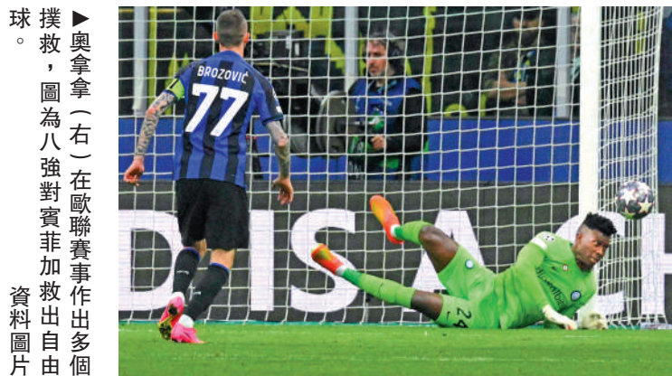
奧拿拿（右）在歐聯賽事作出多個撲救，圖為八強對賽非加救出自由球。