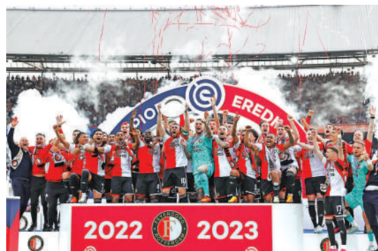
▲飛燕諾大勝伊高斯後提前兩輪獲得荷甲冠軍。

【大公報訊】據ESPN FC報道：巴塞隆拿昨晨篤定贏得今季西甲錦標，該隊在加泰隆「打吡戰」作客以4：2擊敗愛斯賓奴後領先次席皇馬14分，提前4輪、時隔4年後重奪錦標，但由於巴塞正在宿敵地頭奪標，完場後慶祝的球員一度被衝入場內的主隊球迷追打，贏了卻要「落荒而逃」。