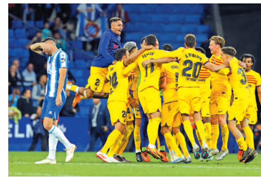
▲巴塞（黃衫）挫愛斯賓奴後，相隔四年再奪西甲錦標。

巴塞甫開賽即顯示贏球決心，羅拔利雲度夫斯基「梅開二度」、守將巴迪射入第2球，令作客的巴塞半場已領先3球，易邊後祖利斯古迪再添1球，後段雖然失回兩球，但仍以4：2獲勝，繼2019年後再奪標，亦是「後美斯時代」首個、隊