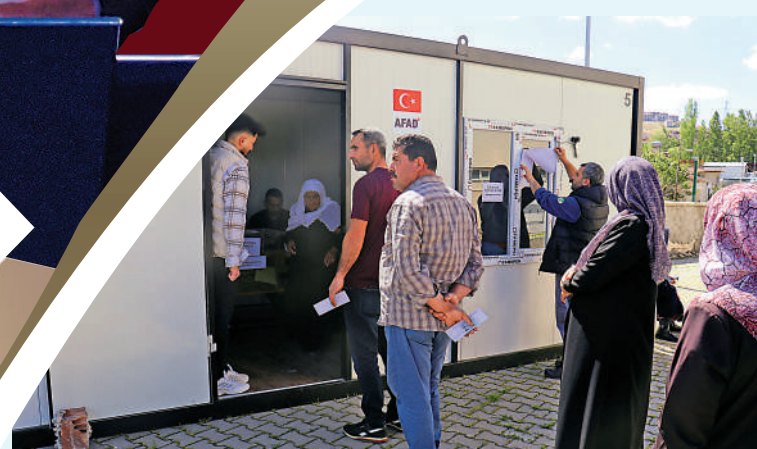
▲土耳其地震災區選民14日在投票點排隊。

不力。然而，15日公布的計票結果顯示，上述8個受災嚴重城市的選民依然在總統選舉中支持埃爾多安，他在加濟安泰普獲得近60%選票，在另外7個城市得票率均超過60%。 在重災區卡赫拉曼馬拉什，埃爾多安獲得近72%選票。當地居民努雷租住的公寓在地震中受損，她至今仍住在政府提供的帳篷裏。但努雷說：「我當然會投票給埃爾多安總統。人們會犯錯誤，儘管如此，你依然要愛他們。首先，真主拯救我們。其次，我們的總統埃爾多安拯救我們。」她的鄰居們在帳篷營地裏唱着讚美埃爾多安的歌謠。 一些土耳其網友對受災民眾的選擇感到失望和難以理解。一名網友說：「我簡直不敢相信。我再也不會為地震災民感到悲傷了。」