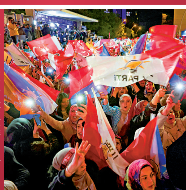
▲埃爾多安的支持者15日在安卡拉街頭慶祝。