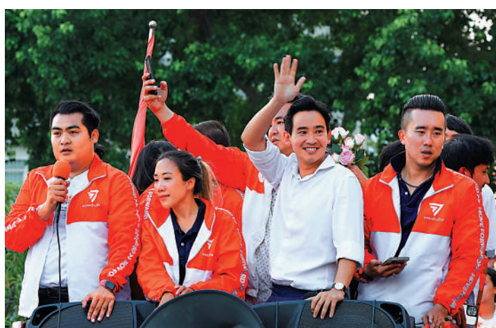
▲前進黨總理候選人皮塔(左三)15日向支持者揮手。