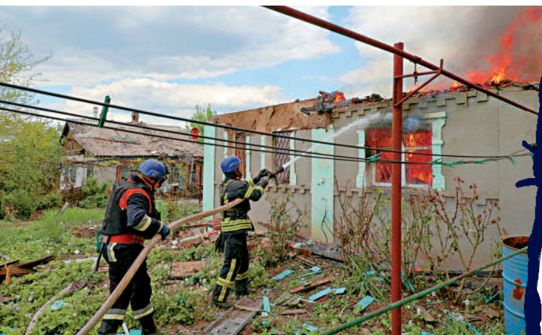
▲烏東戰況激烈，圖為消防員在頓涅茨克滅火。

自俄烏衝突爆發以來，以美國為首的西方國家已經對俄羅斯實施了10輪制裁，目前正在醞釀第11輪。英國《金融時報》14日援引參與談判的官員報道稱，歐盟和G7國家將禁止在已經中斷的俄羅斯天然氣管道上進口天然氣，這將是俄烏衝突爆發以來西方國家首次阻止管道天然氣貿易。報道稱，這一決定將在下周舉行的G7廣島峰會上敲定。