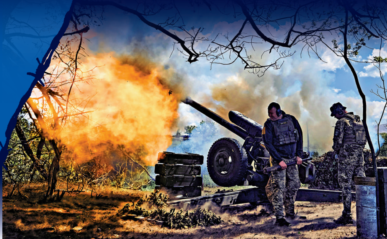
▲烏克蘭士兵12日在巴赫穆特附近向俄陣地開炮。

【大公報訊】綜合CNN、路透社、《衛報》報道：俄羅斯國防部15日首次宣布，成功擊落了英國上周剛向烏克蘭提供的一枚遠程「風暴陰影」導彈。俄烏兩軍繼續在烏克蘭東部戰略重鎮巴赫穆特激戰，俄國防部14日表示，烏軍過去一天在巴赫穆特北部及南部猛烈反攻，全被俄軍擊退。有兩名來自不同單位的指揮官，在嘗試擊退烏軍時陣亡。