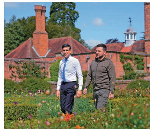
▲澤連斯基(右)15日到訪英國與蘇納克會面。

14日，澤連斯基在訪問柏林期間，否認了「烏克蘭打算深入攻擊俄羅斯本土」的說法。澤連斯基說：「我們既沒有時間也沒有力量(攻擊俄羅斯本土)」，而且我們沒有多餘的武器可以用來做這件事。」