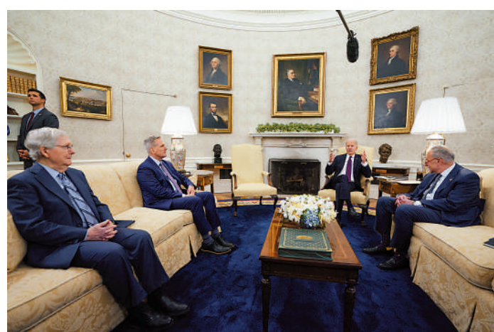
▲拜登9日與國會兩黨領導人討論債務問題，未有進展。

受美國債務上限危機影響，外界曾猜測拜登未必前往日本出席G7峰會。但白宮14日表示，拜登18日會啟程赴日，至下周日(21日)才會返美。白宮還表示，拜登19日將與日本首相岸田文雄會晤。韓國總統同日透露，總統尹錫悅以受邀身份參加G7峰會期間，將與拜登及岸田舉行韓美日首腦會談，時間可能定於21日。拜登16日將與眾議院議長麥卡錫等4名