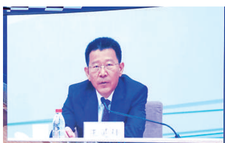
▲王靈桂表示，香港背靠祖國，聯通世界，在強國建設中地位重要，優勢獨特。

穩步推進國家金融市場對外開放，吸引更多國際資本到內地投資，分享中國的發展紅利，並在過程中不斷增強香港的競爭優勢，推進香港經濟實現更高質量發展。相信有中央大力支持，有祖國內地作堅強後盾，香港的獨特地位和優勢會更加突顯，在新時代、新征程上，香港「機遇無限，大有可為」。