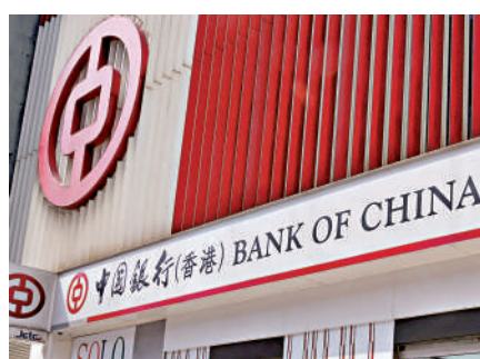
▲北向互換通首日交易，中銀香港即參與交易。

以中銀香港為例，昨日通過彭博及Tradeweb電子交易平台，完成多筆北向互換通交易，覆蓋FR007(7天回購定盤利率)、SHIBOR(上海銀行間同業拆放利率)3個月等主要參考利