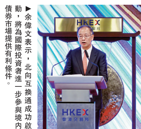
▲余偉文表示，北向互換通成功啟動，將為國際投資者進一步參與境內債券市場提供有利條件。

港交所集團行政總裁歐冠昇表示，互換通是全球首個衍生品市場的互聯互通機制，日後將是人民幣國際化進程的重要組成部分，可為人民幣國際化進程提供支持，提升人民幣在全球貨幣市場的地位。