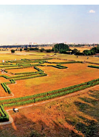
▲殷墟是中國商代晚期的都城，距今已有3300年的歷史。