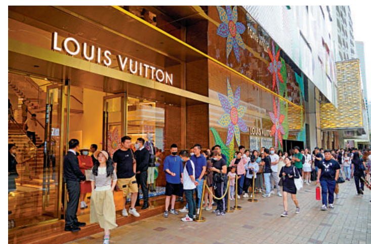
◀四月份訪港旅客有289萬人次，▲五一黃金周有不少內地旅客來港，部分人光顧名店。大公報記者何嘉駿攝 大公報記者林少權攝

另外，香港旅遊發展局昨日公布，四月的初步訪港旅客數字為289萬人次，按月增加約18%，以日均旅客計算，相等於疫情前約58%，訪港旅客主要來自內地及東南亞市場，內地今年的五一長假期於四月底展開，令內地旅客增幅顯著，其他市場方面，齋戒月完結及復活節帶動下，來自東南亞的旅客亦錄得較高的增長。