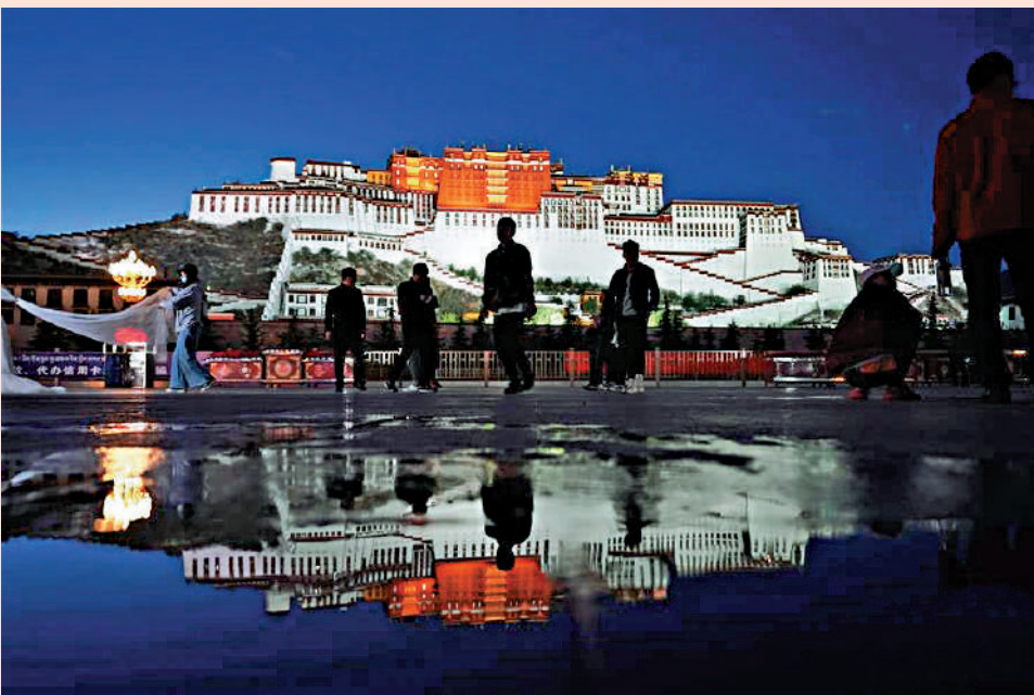
▲布達拉宮是西藏的最好名片。

去西藏一趟，彷彿是一場修行。遠離城市的喧囂，唯獨剩下頭頂的天空和腳下的土地。站在高處呼喊，陣陣回音讓我們流連忘返liú lián wàng fǎn。有首歌這樣唱：「生靈順從雅魯藏布江流淌，時光在布達拉宮越拉越長。」對於內陸的人而言，歌詞唱的確實不假。當內陸夜幕已經降臨的時候，太陽還在西藏照耀着雪域高原。當然，西藏不止有自然風光，它的人文景觀更是藏區獨有的