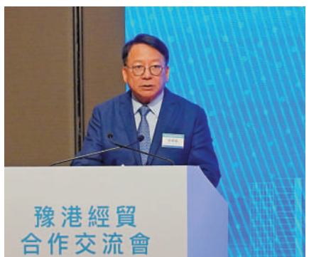
▲政務司司長陳國基指出，香港是河南最大的外資來源地，也是河南的重要貿易夥伴。

出席昨日豫港經貿合作交流會的人士包括河南省省長王凱以及河南省直有關部門、省屬有關企業、各省轄市（區）政府主要負責人；香港特區政府政務司司長陳國基；外交部駐港特派員公署特派員劉光源；中聯辦副主任尹宗華；香港立法會主席梁君彥；華潤（集團）董事長王祥明；全國政協常委、香港義工聯盟主席、香港各界慶典委員會主席譚錦球；全國政協常委、港區省級政協委員聯誼會會長、香港恒通資源集團執行董事施榮懷；全國政協常委、中國和平統一促進會香港總會會長姚志勝；全國政協教科衛體委員會副主任、香港聯誼總會榮譽主席、香港宏安集團主席鄧清河；全國政協委員、香港大公文匯傳媒集團董事長、總編輯兼大公報社長、文匯報社長李大宏等。 本次交流大會的主題是「豫見香港 攜手共贏」。王凱在致辭時表示，河南與香港人緣相親，文脈相通，歷史淵源悠久，合作基礎深厚。香港是河南第一大外資來源地，也是河南企業走出去的首選平台，在經貿、產業、科教、文化等領域結下了豐碩的合作成果，為河南改革發展提供了有力支撐。王凱表示，河南省此行與香港工商界、金融界、行業協會以及部分世界500強企業負責人進行了廣泛接觸和深入交流，並誠邀香港各界朋友多到河南走一走，看一看，深入了解河南，在河南共享發展機遇，共創光明未來。