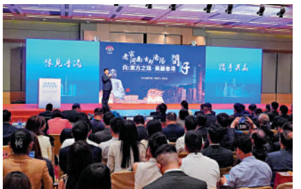
▲河南省市官員在交流會上，介紹了多項招商項目。

河南作為全國教育人口第一大省，把實施創新驅動、科教興省、人才強省戰略作為「十大戰略」之首，着力打造一流創新生態，建設國家創新高地和重要人才中心。河南希望與香港的高校聯合設立鄭州研究院，共同建設一批科技研發中心和成果轉化平台，打造「香港技術+河南轉化」新模式。」