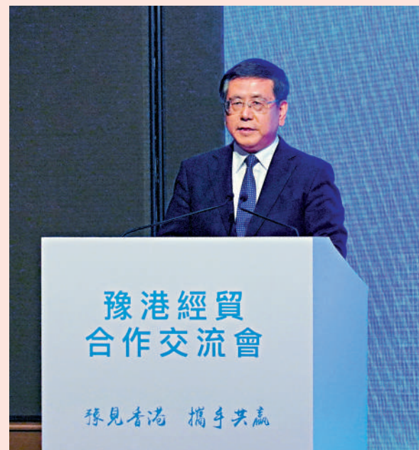
▲河南省省長王凱在致辭時，誠邀香港各界朋友多到河南走一走，看一看。

「香港是一座高度繁榮的自由港和國際大都市，三天來的考察交流，我們深切感受到香港的巨大變化，這種由治及興的變化令人振奮，深受鼓舞。」河南省省長王凱昨日在港舉行的豫港經貿合作交流會上表示，希望以本次合作交流為契機，把國家所需、香港所長、河南所有融合起來，共同推動粵港澳大灣區、黃河流域生態保護和高質量發展等國家重大戰略落地做深做實。交流會現場還簽約了18個項目，涵蓋裝備製造、節能環保、電子信息、新能源、新材料等領域。