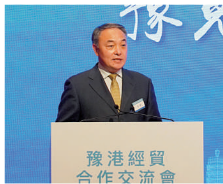
▲河南省發展和改革委員會主任馬健推介了河南省在四個領域的招商項目。