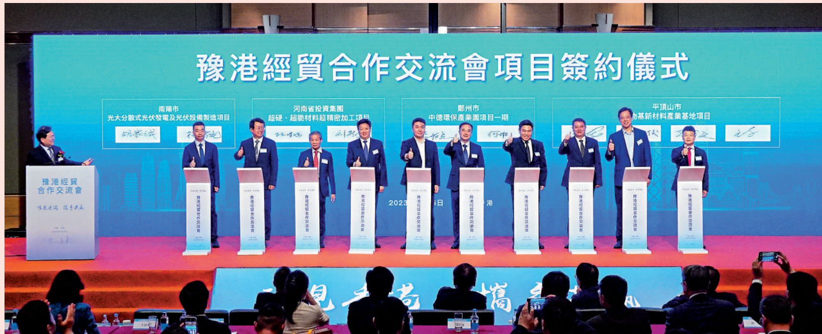
▲豫港兩地在經貿合作交流會上，簽約了18個項目，涵蓋裝備製造、節能環保、電子信息、新能源、新材料等領域。