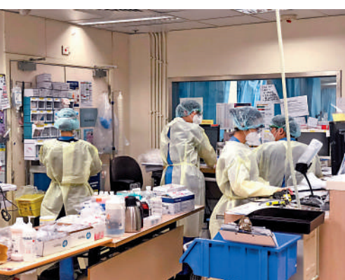
▲廣東省衛健委透露，正籌備讓香港傳染病科醫生、感染控制科護士，以及實驗室人員赴粵交流。

【大公報訊】醫管局推出「大灣區醫療人才交流計劃」，首批83名醫護早前來港作交流。廣東省衛健委黨組書記、主任朱宏在醫管局研討大會透露，正籌備讓香港傳染病科醫生、感染控制科護士，以及實驗室人員赴粵交流。醫務衛生局局長盧寵茂昨日分別與廣東省衛生健康委員會黨組書記、主任朱宏，以及深圳市衛健委黨組書記、主任吳紅艷，及他們率領的代表團舉行會