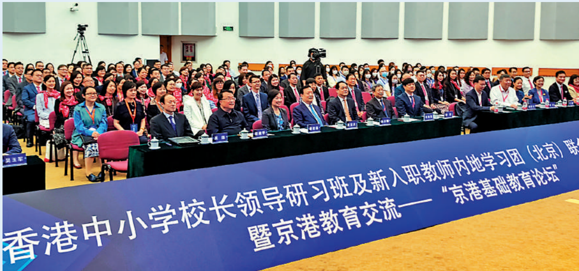
香港中小學校長領導研習班及新入職教師內地學習團（北京）聯合開班暨京港教育交流——「京港基礎教育論壇」

▲香港中小學校長領導研習班及新入職教師內地學習團（北京）聯合開班暨京港教育交流——「京港基礎教育論壇」16日在北京師範大學舉行。大公報記者江鑫嫻攝