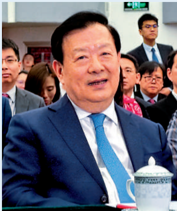
▲國務院港澳事務辦公室主任夏寶龍看望參會的校長及新入職教師。