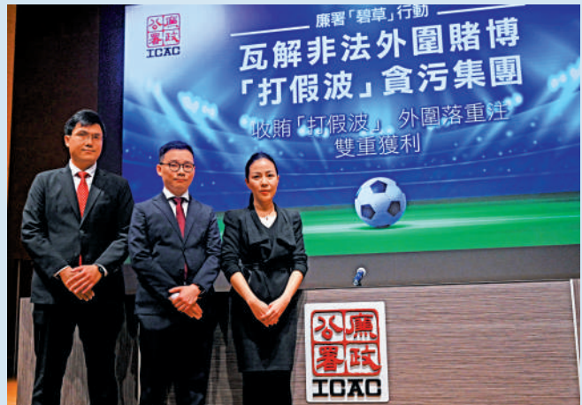
▲廉署瓦解一個涉及非法外圍賭博的「打假波」集團，拘捕23人，包括一支甲組球隊的11名球員和1名教練。