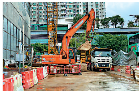
▲一名男工昨日在土瓜灣中九龍幹線地盤內被叉車撞倒，頭部重創，送院不治。

半清醒，被送往威爾斯親王醫院搶救，直至昨日中午情況仍然危殆。警方在現場檢獲一封遺書，將案件列作企圖自殺案處理。消息指事主是一名大專一年級生，懷疑在使用交友程式時被騙去大量金錢，因為無力償還而選擇自尋短見。