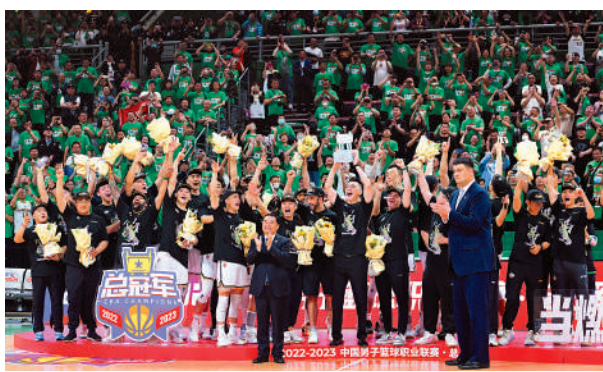
▲遼寧隊在頒獎儀式上慶祝奪冠。新華社