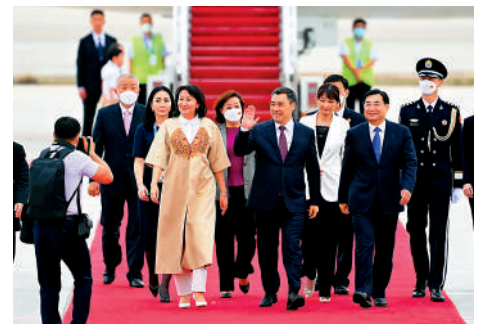
▲5月17日傍晚，出席中國—中亞峰會的吉爾吉斯斯坦總統扎帕羅夫抵達陝西省西安市。

會談後，兩國元首簽署了《中華人民共和國和哈薩克斯坦共和國聯合聲明》（下稱《聯合聲明》），共同見證簽署經貿、能源、交通、農業、互聯互通、人文、地方等領域多項雙邊合作文件。《聯合聲明》中提到，雙方商定採取措施保障中哈原油管道、中國—中亞天然氣管道哈薩克斯坦境內段的長期安全穩定運營和按計劃穩定供應，繼續深化石油、天然氣、天然鈾等領域合作，積極拓展風電、光伏、光熱、核電等清潔能源領域合作。 蔡奇、王毅、秦剛等參加上述活動。