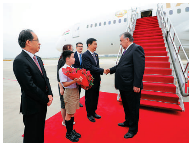
▲5月17日下午，出席中國—中亞峰會的塔吉克斯坦總統拉赫蒙抵達陝西省西安市。新華社

【大公報訊】據新華社報道：中國常駐聯合國副代表戴兵16日在聯大審議中亞和平、信任與合作區議題時發言，表示中方願同中亞國家不斷拓展全方位合作，推動彼此關係再上新台階。