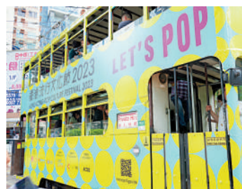
▲「電影叮叮」為「香港流行文化節2023」節目之一。

日期：5月20日至6月11日 路線：東行線（上環至銅鑼灣） 西行線（銅鑼灣至上環） 名額：每團共15人 時間：全長約2小時 費用：港幣100元/位