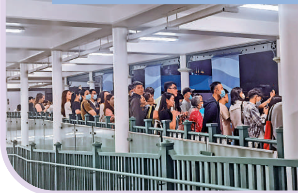
▲場外觀眾於碼頭天橋上遙看周杰倫演唱會。