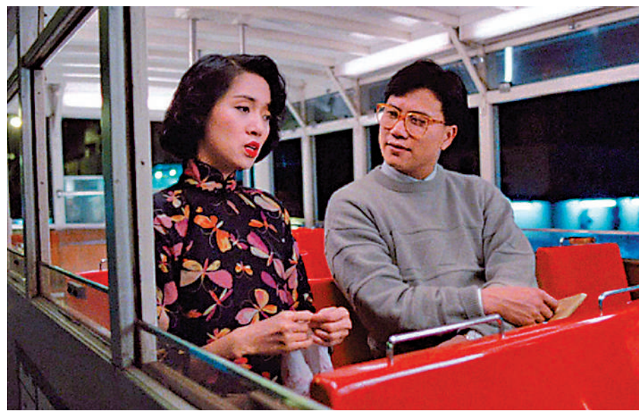
◀電影《胭脂扣》在電車取景。

作為「香港流行文化節2023」節目之一，由康文署主辦的「電影叮叮」自推出以來反應熱烈。為了讓更多市民及遊客能體驗這項獨特的文化之旅，節目日前加開26場，並請到關錦鵬、許鞍華等知名電影人擔任嘉賓，在電車上與參與者分享拍攝電影的幕後故事、創作靈感等。6月份的加場門票將於明日（19日）起在城市售票網發售，帶領市民乘坐叮叮車同遊中西區，享受電影文化體驗之旅。