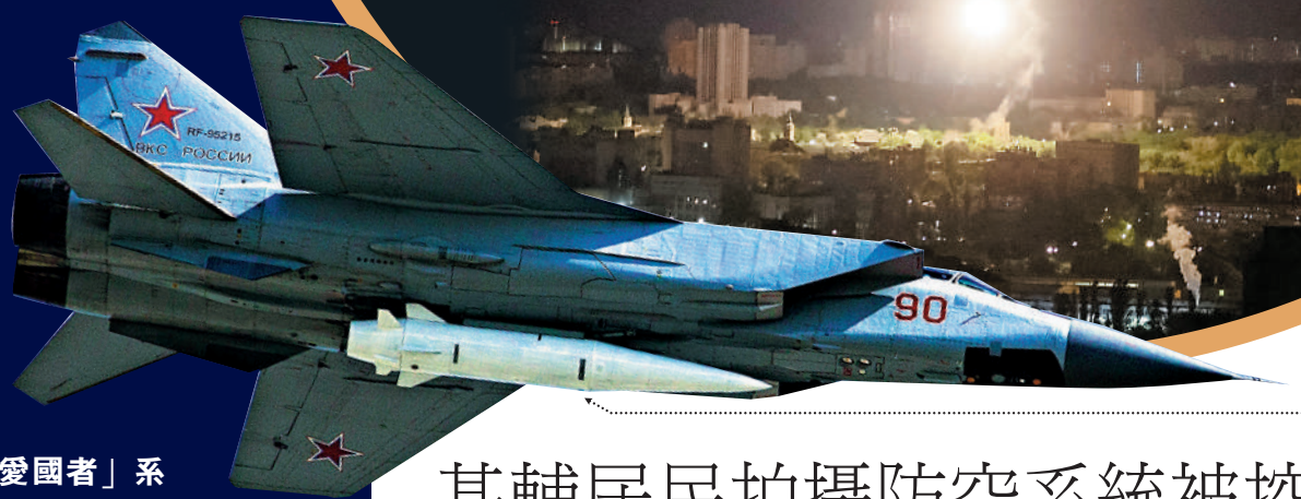
◀俄軍16日凌晨對基輔發動空襲。

【大公報訊】綜合CNN、路透社、法新社報道：當地時間16日凌晨，俄羅斯對烏克蘭首都基輔發動猛烈空襲。俄國防部稱，俄軍用一枚「匕首」高超音速導彈摧毀了一套美製「愛國者」防空系統。烏軍否認俄方說法，並聲稱俄軍共發射6枚「匕首」導彈，全部被烏軍攔截，目前「愛國者」系統仍在正常運作。美國官員透露，「愛國者」系統的確在空襲中受損，但美方評估認為只是「輕微損傷」，不必將其撤出戰場。