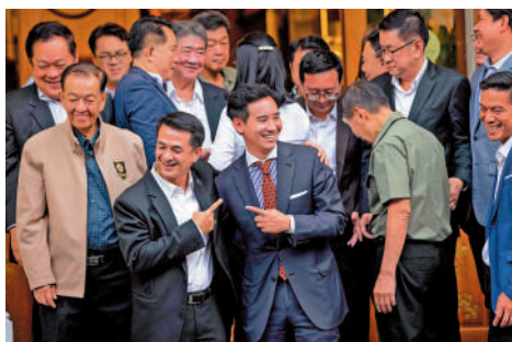
▲前進黨黨魁皮塔（中）17日與潛在的反對黨盟友會面。

路透社稱，雖然前進黨是第一大黨，但為泰黨在接下來的談判中有更多籌碼。若想結成穩定聯盟，爭取佔據70席的泰自豪黨和佔據25席的民主黨支持至關重要。但由於前進黨堅持要求進行王室改革，這兩個黨不太願意與其合作。