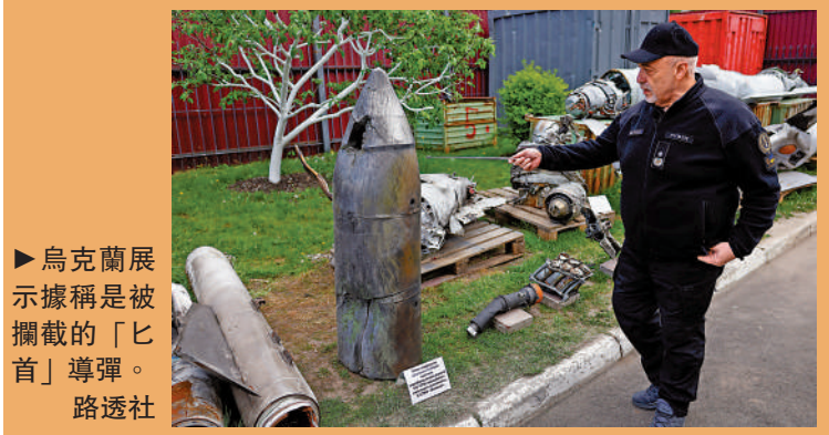
▶烏克蘭展示據稱是被攔截的「匕首」導彈。