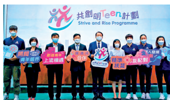
▲「共創明Teen」計劃第一期有2800名學員參加，反應理想。

孫玉菡續稱，截至今年2月底，有16名友師、21名學員退出該計劃，每人退出原因不同。政府會檢討該計劃第一期成效，考慮增加學員名額和擴大目標群組等方向，優化該計劃並推出第二期。