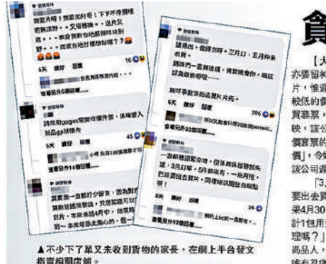
▲不少下了單又未收到貨物的家長，在網上平台發文指責有關網店。

【大公報訊】電話諮詢網購多，網上購物亦須留意。近期多名媽媽在「Baby-Clan」網店購買尿片，惟遲遲未有出貨，加上有關公司以市價較低的價錢出售尿片，吸引不少媽媽先購買套票，再付貨單形式換取尿片。有媽媽反映，當可不停催促催單，但未有出貨，懷疑受騙。網購家長不滿，更會要求網店「退錢」，令媽媽們大失所望。在巨大的壓力下，使該公司遲遲未出貨，令人懷疑受騙。