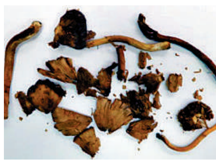
▲女病人提供導致中毒的野菇樣本，基因排序發現與海南醫學院團隊發現的新品種真菌屬同一品種。