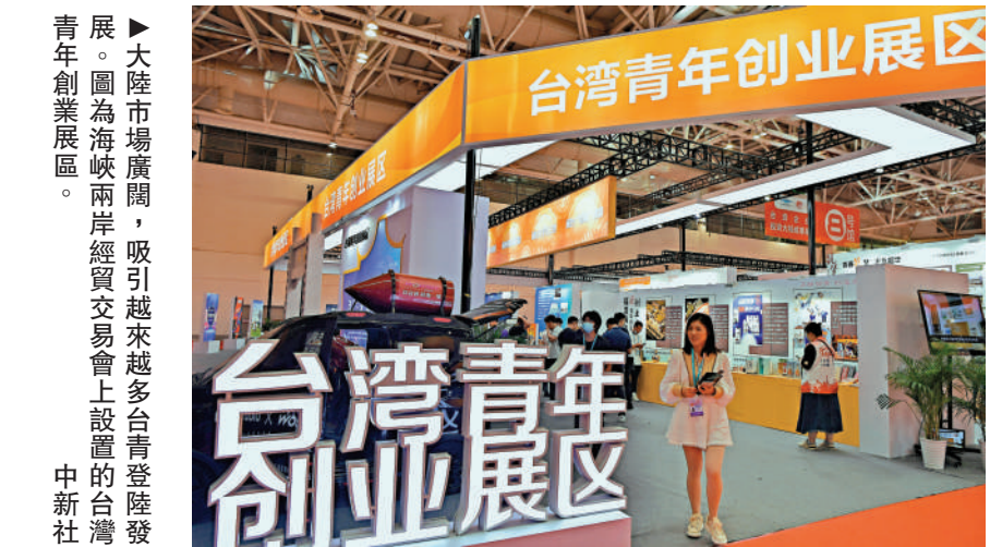
▶大陸市場廣闊，吸引越來越多的台灣青年創業展區。圖為海峽兩岸經貿交易會上設置的台灣青年創業展區。