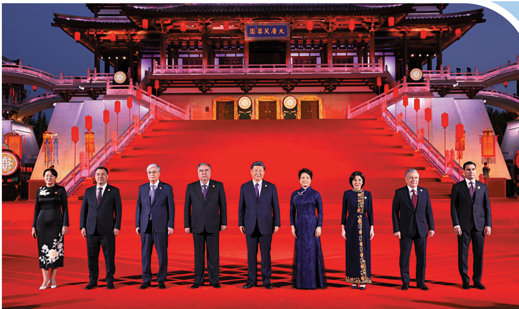
▲5月18日晚，國家主席習近平和夫人彭麗媛在陝西省西安市大唐芙蓉園為出席中國—中亞峰會的中亞國家元首夫婦舉行歡迎儀式和歡迎宴會。宴會後，習近平夫婦同貴賓們共同觀看中國同中亞國家人民文化藝術年暨中國—中亞青年藝術節開幕式演出。這是習近平夫婦在紫雲樓前同貴賓合影留聲。新華社

【大公報訊】據新華社報道：5月18日至19日，首屆中國—中亞峰會在陝西西安舉行。此次峰會是今年中國首場重大主场外交活動，國家主席習近平主持峰會。17日下午起，習近平陸續與抵達西安參加中國—中亞峰會的哈薩克斯坦、吉爾吉斯斯坦、塔吉克斯坦、烏茲別克斯坦、土庫曼斯坦等中亞五國元首會談。18日，習近平在與烏茲別克斯坦總統米爾濟約耶夫會談時指出，中國—中亞峰會是中國—中亞關係史上新的里程碑，願同烏方攜手構建更加緊密的中國—中亞命運共同體。同日，習近平在與塔吉克斯坦總統拉赫蒙會談時表示，此次中國—中亞峰會一定能開成一次內容豐富、成果豐碩的峰會，開啟中國—中亞合作新時代。