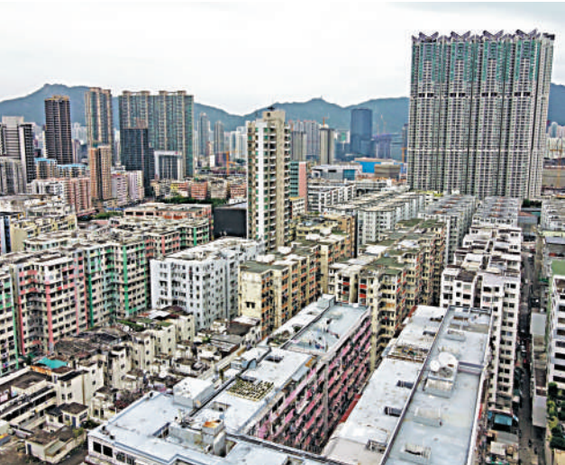
▲大批土地契約於2025年起陸續到期，政府計劃立法簡化地契續期手續。

【大公報訊】記者賴振雄報道：本港大批土地契約將於2025年起陸續到期，政府計劃下半年提交草案，以立法形式讓政府有權透過刊憲形式，宣布地契續期生效。政府計劃在每批到期地契限期日約三年前，刊憲宣布是否續期，並傾向只列出不獲續期的地契。相關地契可獲續期50年，業權人毋須補地價，但須每年繳納相當於應課差餉值3%的地租。