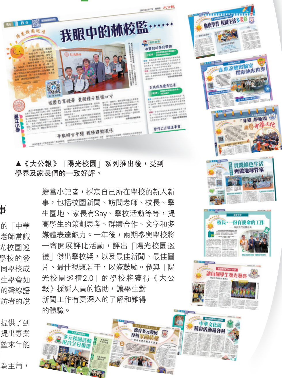
▲《大公報》「陽光校園」系列推出後，受到學界及家長們的一致好評。

擔當小記者，採寫自己所在學校的新人新事，包括校園新聞、訪問老師、校長、學生園地、家長有Say、學校活動等等，提高學生的策劃思考、群體合作、文字和多媒體表達能力。一年後，兩期參與學校將一齊開展評比活動，評出「陽光校園巡禮」傑出學校獎，以及最佳新聞、最佳圖片、最佳視頻若干，以資鼓勵。參與「陽光校園巡禮2.0」的學校將獲得《大公報》採編人員的協助，讓學生對新聞工作有更深入的了解和難得的體驗。