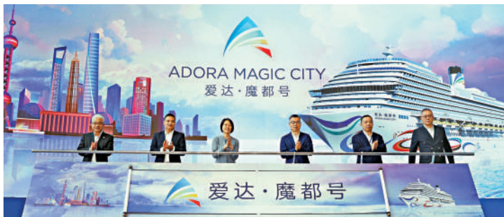
►19日，「愛達·魔都號」（Adora Magic City）船名發布儀式。

作為「上海設計」、「上海製造」的郵輪，取名「魔都」十分貼切，也強調了立足上海主場，弘揚海派文化，傳承城市品格的宏偉目標。「魔都」（Magic City）船名凸顯了首艘國產大型郵輪在設計上的追求——以「摩登」詮釋郵輪之都的時尚潮流，以「魔力」展現經典文化的創新魅力，以「魔幻」帶來東西方文旅要素的跨界融合，與中國賓客共創充滿想像力的海上文化探索之旅。