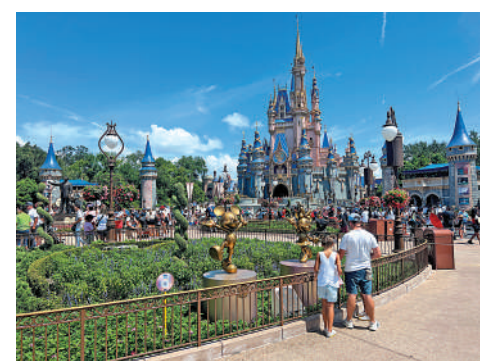
▲迪士尼18日宣布取消對佛州的一項投資計劃。