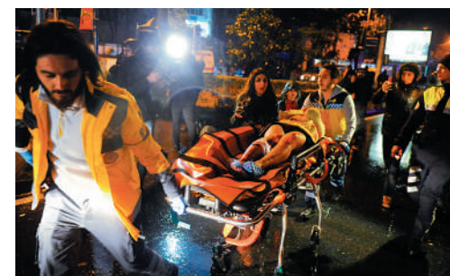
▲2017年伊斯坦布爾恐襲受害者的家屬指控社媒放任涉恐內容傳播。

美媒指出，最高法院迴避了有關《通訊規範法案》第230條的爭議。該條款保護網絡平台免於為用戶發布的內容承擔責任，近年受到越來越多的質疑，多名議員要求對其進行修訂，讓社交媒體承擔更多責任。