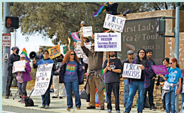
▲德桑蒂斯近期推出多項有爭議的法案，引起部分民眾抗議。

【大公報訊】綜合《紐約時報》、《華盛頓郵報》、彭博社報道：消息人士透露，美國佛州州長德桑蒂斯預計將於下周正式宣布參加2024年總統選舉。德桑蒂斯被視為美國前總統特朗普在共和黨內部的最大競爭對手。根據一段電話錄音，他私下向共和黨金主和支持者說，特朗普無法再次贏得選舉，「只有（現總統）拜登和我有機會成為下一任總統」。過去幾個月，德桑蒂斯簽署多項討好右翼選民的法案，為參選作鋪墊。