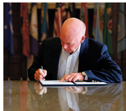
▲蒙大拿州州長吉安福特17日簽署TikTok禁令。

提起訴訟的用戶和創作者在TikTok平台上共有50多萬粉絲，包括一名曾在美國海軍陸戰隊服役的女兵。他們起訴的對象是禁令執行者、蒙大拿州總檢察長克勞森。訴訟聲明中寫道，該禁令違反了美國憲法第一修正案賦予用戶的言論自