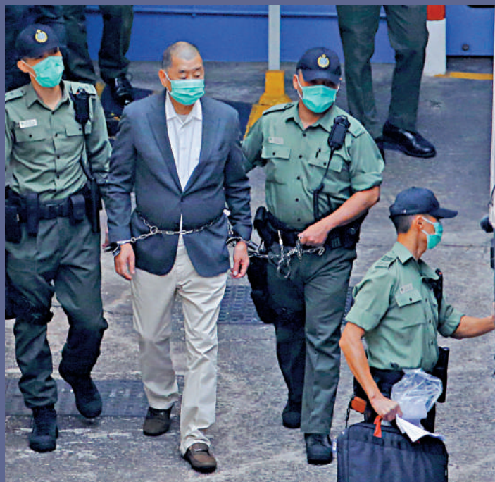
▲黎智英早前入稟高院，要求律政司宣布全國人大釋法不影響其聘外國律師Tim Owen，高院昨日駁回申請。