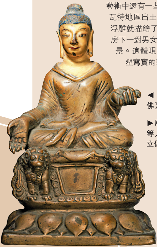
▲《釋迦牟尼佛》金銅造像。

值得一提的是，佛傳故事是犍陀羅藝術的經典題材。展覽中，來自白沙瓦博物館的佛傳故事浮雕像龕從上到下刻畫了離開毗舍離城、佛陀涅槃、分舍利、起塔供養四個場景，這樣嚴格按照時間順序表現佛傳故事的作品較為少見。此外，犍陀羅藝術中還有一些世俗題材的作品，斯瓦特地區出土的情侶與毗耶羅浮雕像就描繪了印度式拱形僧房下一對男女相互愛慕的情景。這體現了犍陀羅雕塑寫實的藝術風格。