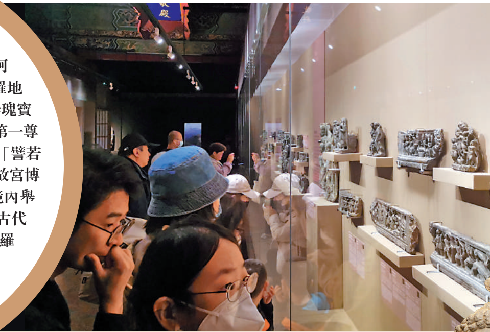
▲觀眾在故宮文華殿參觀展覽。