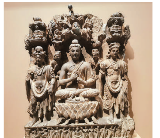
▲展覽的《舍衛城神變》浮雕，佛陀居中坐於芒果樹下，全跏趺坐於一朵盛開的碩大蓮花上，兩側站立二菩薩，背後左右亦站立二人。