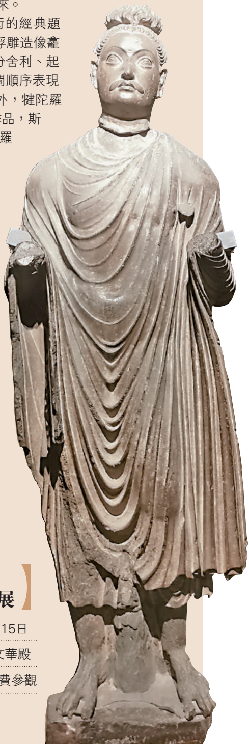
▶展廳正中一尊等人身高的《佛立像》。