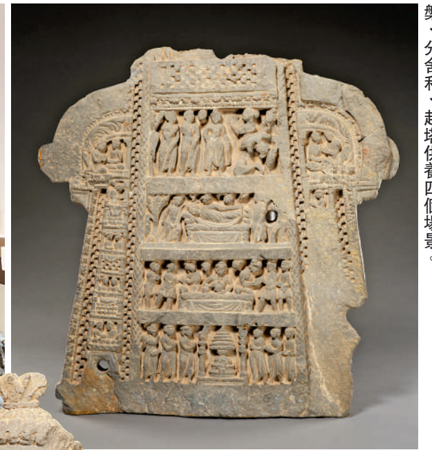
▲《佛傳故事》浮雕作品，自上而下刻畫了離城、佛陀涅槃、舍利、起塔供養四個場景。