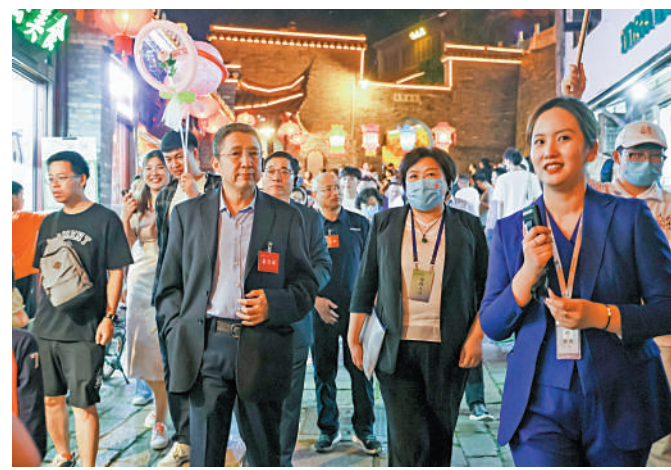
▲海內外鄉賢走進鎮江歷史文化街區西津渡，感受家鄉變化。