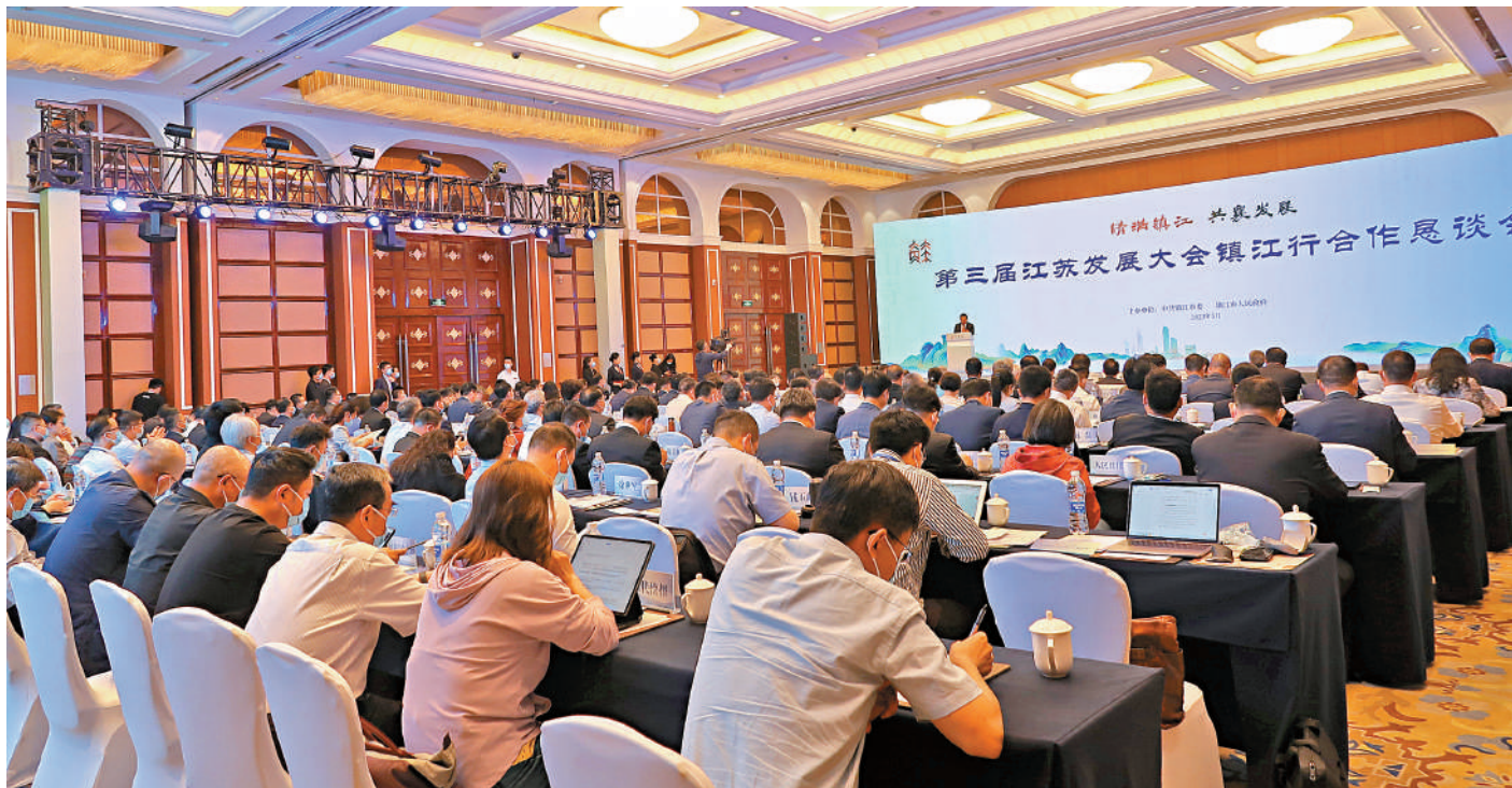
▲在「情滿鎮江 共襄發展」第三屆江蘇發展大會鎮江行合作懇談會上，參會人士就推動高質量發展進行交流。

「世界上最美的風景、最溫暖的路是回家的路。作為一名材料化學的科研工作，我曾參與了鎮江化工行業建設，也在思考家鄉的發展路徑。」同濟大學化學科學與工程學院院長、歐洲科學院院士、德國工程院院士張弛表示，科技創新是一個國家、一個城市贏得未來的關鍵，他建議鎮江創立新質高科技創新研究所、實驗室、中心，「這樣的機構一定能引領鎮江的發展。」張弛認為，通過建設高質科創發展中心，可吸引海內外優秀人才引進，引進最先進的裝備設備，強化與世界著名高校科研機構和世界500強企業的合作，推動科技創新和產業轉型升級，「這必將有助於提高鎮江城市的產業創新能力和科技競爭力，促進經濟的可持續發展。」