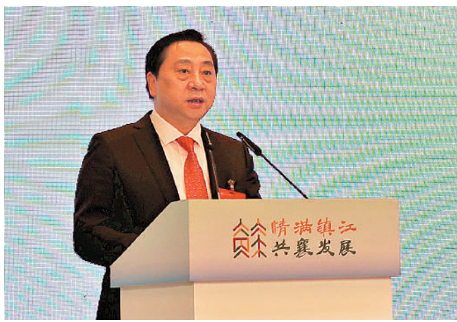
▲中共鎮江市委書記馬明龍寄語廣大鄉賢助力鎮江高質量發展。