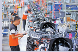
▲常州一家車企內工人正在作業。

●新能源、新型材料、新一代信息技術相關產品產量較快增長，其中新能源汽車、鋰離子電池、太陽能電池、工業機器人、碳纖維及其複合材料、智能手機、服務器產量分別增長93.2%、23.4%、36.2%、11.3%、64.6%、49.5%和114.3%。