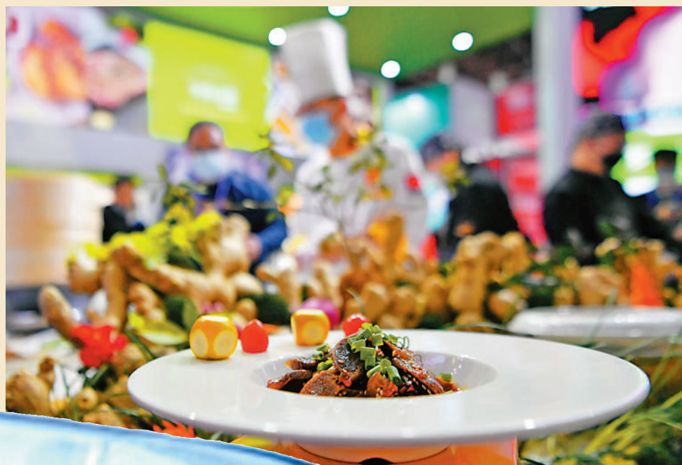
▲前年在福州舉行的中國預製菜產業大會暨展覽會現場，參展商展示一盤快熟的預製菜品。