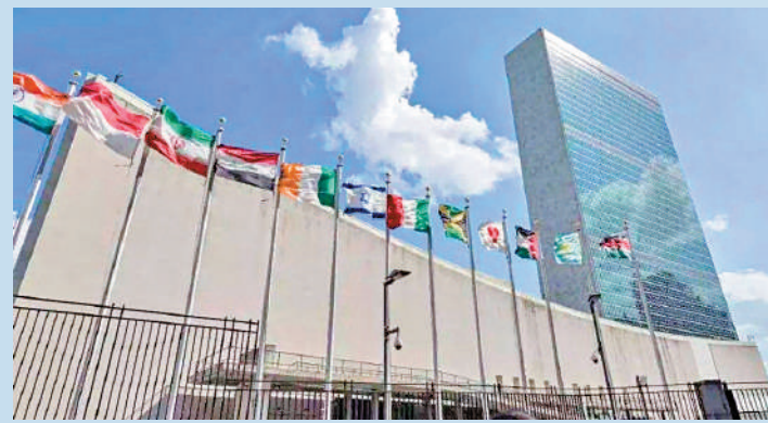
▲第二批香港青年公務員獲外交部推薦進入聯合國機構工作，人數是2019年首次參與的兩倍多。圖為紐約聯合國總部。