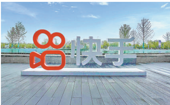
▲快手上季扭虧為盈，經調整業績賺4200萬元人民幣。

集團首季毛利率按年提升4.7個百分點，首席財務官金秉表示，隨着降本增效的效果呈現，集團毛利率持續改善，未來在收入結構變化下，包括通過高毛利廣告及電商業務，進一步推動毛利率。