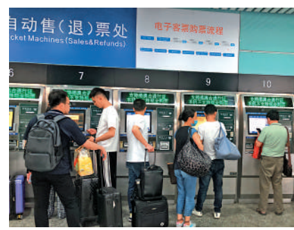
▲旅客在廣州東站購票。

末都北上深圳，也有攜帶家人到珠三角城市遊玩。」她稱，現在廣深城際加開「大站直達」列車，從深圳到東莞、廣州更省時，而且驗證閘機也有技術更新，持港澳台居民居住證、港澳居民來往內地通行證等證件也能自助驗證，通行效率更高。