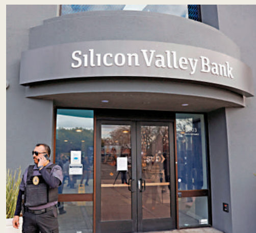
▲第一公民銀行3月27日收購倒閉的硅谷銀行, 約過了兩周, 滙豐即從該行挖角。