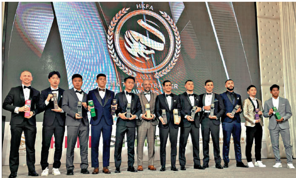
▲香港足球明星選舉得獎球員、教練合照。

年度盛事 闊別4年的香港足球明星選舉實體頒獎禮，昨晚在九龍灣圓滿結束。應屆「3冠王」傑志和東方成為大贏家，各自贏得5個獎項，其中傑志鋒將明加索夫更大熱榮膺最佳前鋒和香港足球先生，加上今季港超神射手，勇奪3項個人獎項威盡全場，他坦言約1年前來港發展是足球生涯最正確的決定。