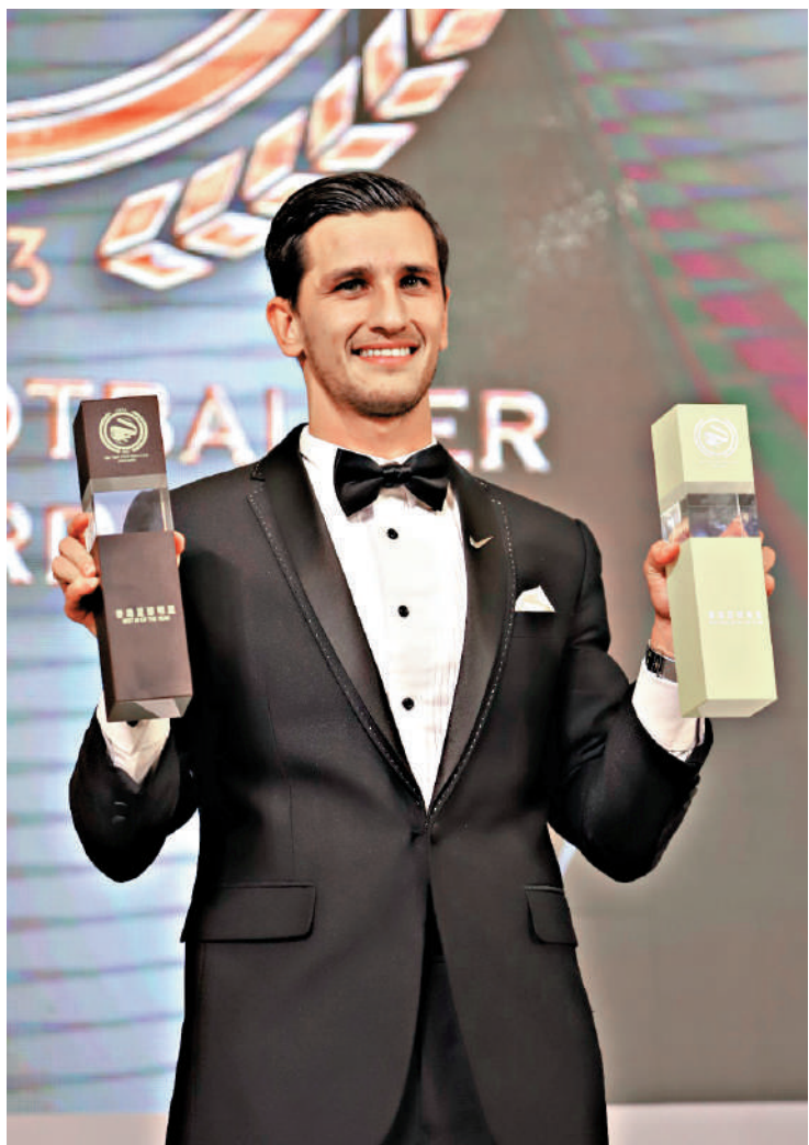
▲明加索夫展示最佳十一人及香港足球先生獎座。