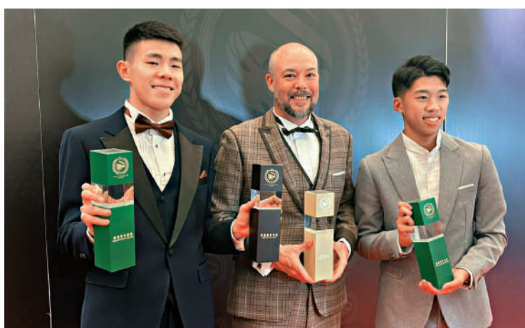
▶明加索夫感謝大家的支持。