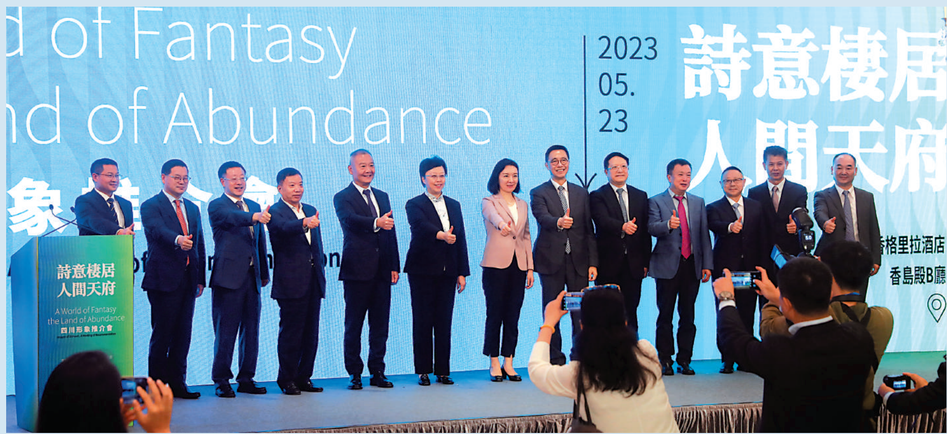
▲「詩意棲居 人間天府」四川形象推介會23日在港舉行。