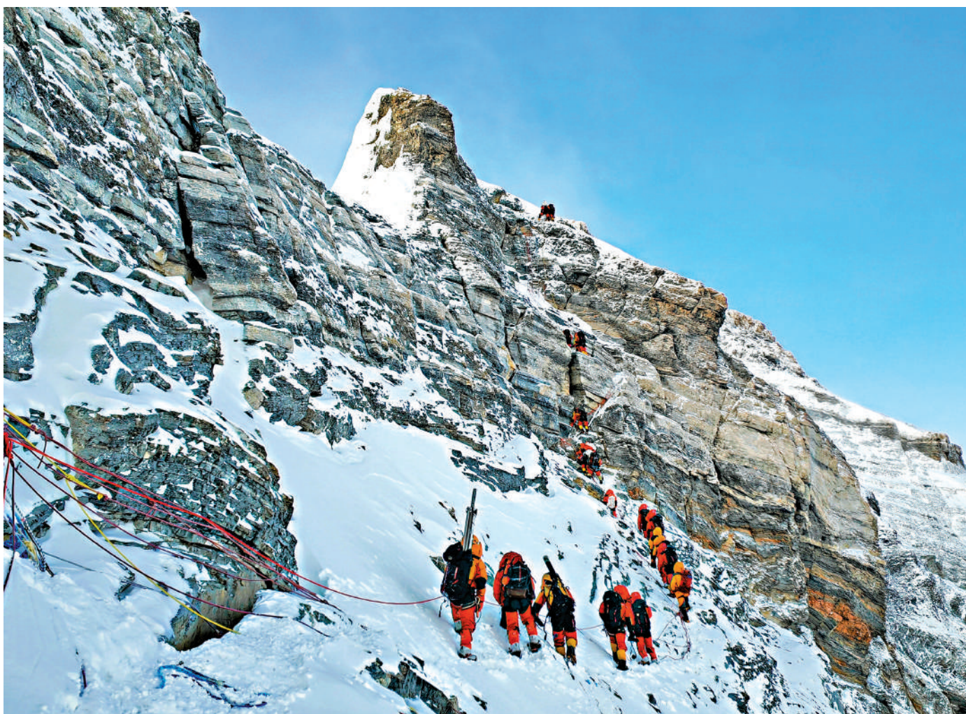
▲5月23日12時30分許，2023年珠峰科考13名登頂隊員成功登頂地球之巔珠穆朗瑪峰。圖為2023年珠峰科考登頂隊員在衝頂。