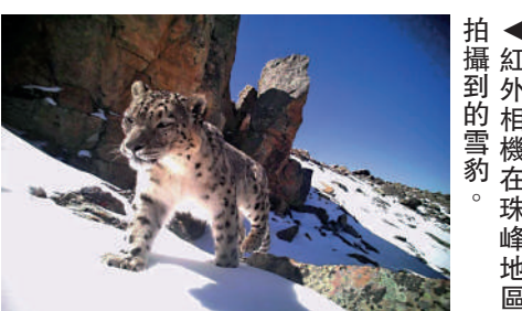
▲紅外相機在珠峰地區拍攝到的雪豹。

西藏自治區林業和草原局日前表示，初步估計珠峰自然保護區內雪豹數量超過百隻。珠峰雪豹保護中心執行主任拱子凌介紹，未來，他們將有針對性地加強珠峰地區的巡邏保護，對雪豹的保護也將更精準化。大公報記者劉凝哲