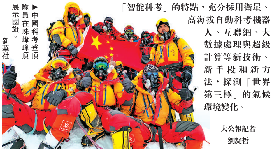
▲中國科考隊隊員在珠穆朗瑪峰頂展示國旗。

5月23日凌晨3時03分，2023「巔峰使命」珠峰科考隊一行13人，從海拔8300米的科考突擊營地出發開始衝頂，12時30分許，所有科考隊員順利攀登至海拔8848.86米的珠穆朗瑪峰頂。這是中國珠峰科考繼2022年之後，再次突破8000米以上海拔高度。23日登頂之後，科考隊完成極高海拔氣象站技術升級、雪冰樣品採集、冰芯鑽取、岩石樣品採集等十多項科考任務。第二次青藏高原綜合科學考察充分體現新時代「智能科考」的特點，充分採用衛星、高海拔自動科考機器人、互聯網、大數據處理與超級計算等新技術、新手段和新方法，探測「世界第三極」的氣候環境變化。