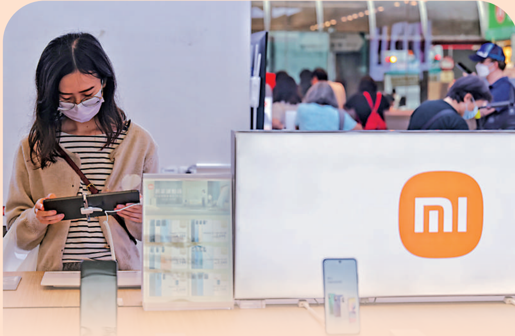
▲小米首季的存貨金額按年下降24%，為近5個季度以來最低水平。