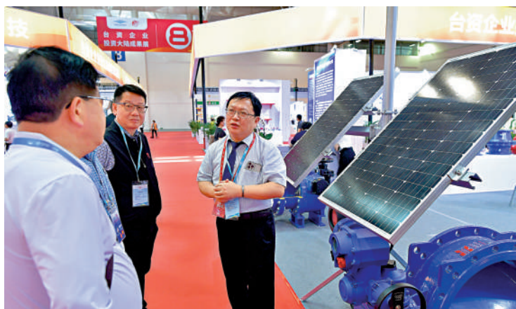
第二十五屆海峽兩岸經貿交易會暨大陸成果展區，首次設置台資企業投資區。

台防務部門負責人邱國正此前稱，台灣正在嘗試通過各種方式降低「延遲交付」帶來的損失，也已向美國方面要求補償，盼望在2026年之前完整交付訂單。