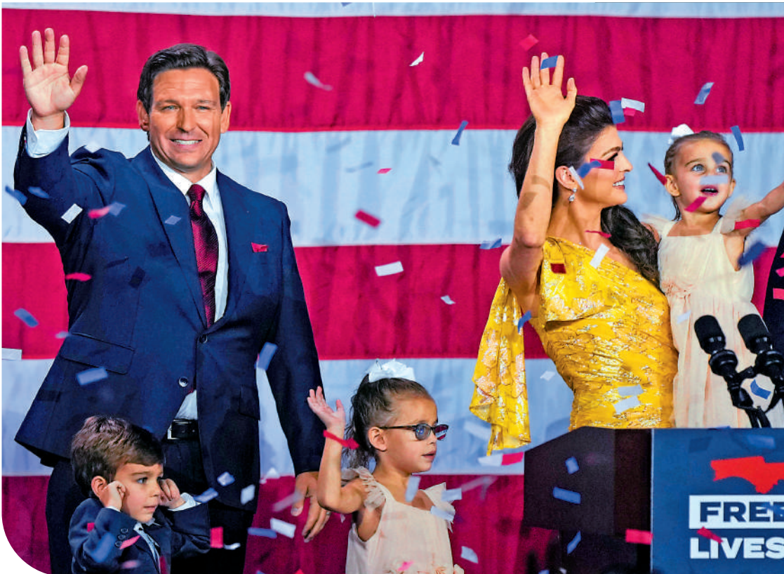
▲去年11月，德桑蒂斯輕鬆連任佛州州長，與妻子和孩子向支持者致意。

分析指，即使特朗普當選總統，最多也只能在白宮多待四年。保守派稱讚特朗普的最重要理由之一，正是其任內在最高法院建立了6:3的絕對多數，讓最高法院去年6月得以推翻保障全國墮胎權的「羅訴韋德案」。有共和黨選民表示，44歲的德桑蒂斯比76歲的特朗普更能代表共和黨的未來。