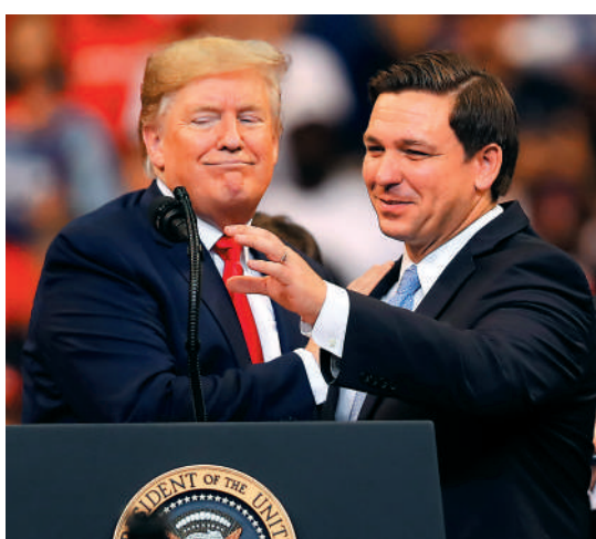
▲特朗普和德桑蒂斯矛盾激化，馬斯克稱自己目前不表態支持特定參選人。

【大公報訊】據BBC報道：美國佛州州長、共和黨人德桑蒂斯當地時間24日下午6時，與馬斯克在「推特空間」直播連線，正式宣布參加2024年大選。馬斯克周二在推特上向自己的1.4億粉絲轉發了兩人進行對談的消息。他表示，自己「目前不表態支持任何一位參選人」。分析指，德桑蒂斯和馬斯克都是懂得吸引媒體關注的高手，德桑蒂斯想借助推特這個平台獲得更多支持，馬斯克則希望將推特打造為線上「市政廳對話會場」，兩人可以說是各取所需。