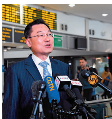
▲5月23日，中國新任駐美大使謝鋒在美國紐約肯尼迪國際機場向新聞媒體發表簡短談話。新華社

【大公報訊】綜合新華社、中通社報道：中華人民共和國主席習近平根據全國人民代表大會常務委員會的決定，任命謝鋒為中華人民共和國駐美利堅合眾國特命全權大使。中國新任駐美大使謝鋒23日抵達美國履新。他在美國紐約肯尼迪國際機場向新聞媒體發表簡短談話時，敦促美國與中方共同努力，加強對話、管控分歧、推進合作，使中美關係回歸正軌。