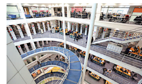
倫敦政治經濟學院的經濟與計量經濟學專業在英國排名第一。

倫敦政治經濟學院經濟學專業學生畢業後，大多從事金融和專業服務、會計與審計、諮詢、信息數字技術和數據、政府公共部門和政策五個行業或機構。