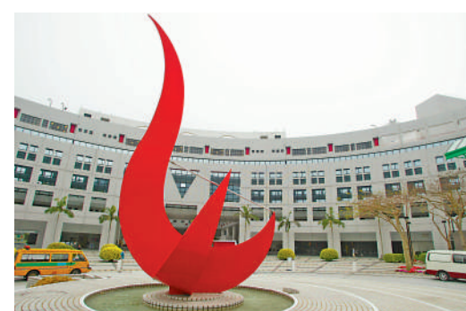
香港科技大學的工商管理學士（經濟學）課程旨在培訓同學運用經濟邏輯和數據作合適的商業決策。

申請香港科技大學聯招的申請人須達到大學的最低入學要求，即中文、英文、數學、通識分別達3分、3分、2分、2分，而兩門選修科目亦需分別達到3分。