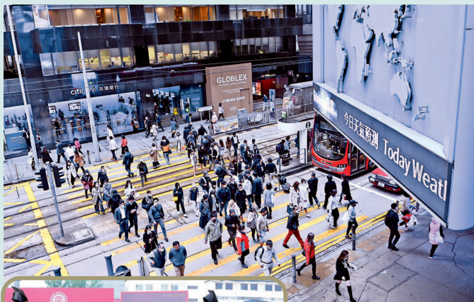
北京大學經濟學與計量經濟學位列全球第28名，全國第一。