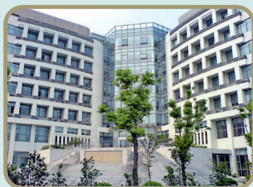
復旦大學經濟學專業旨在培養熟悉現代西方經濟學理論，比較熟練地掌握現代經濟學分析方法的專才。