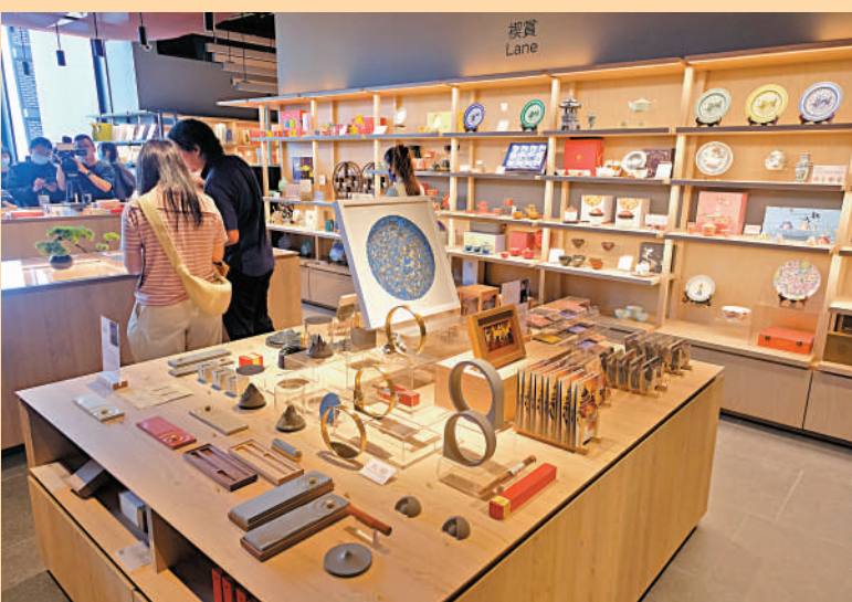
▲博物館禮品店以「皇帝的多寶格」為設計理念。