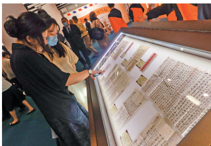
▲觀眾在現場參觀汕頭僑批文化藝術展。

揭幕儀式當天吸引很多市民參觀，也有西人對展覽感興趣，有中學校老師帶領學生前來參觀，小朋友在現場模擬當年老一輩寫僑批的做法，在特製的明信片上寫下自己的心願，投進一個特製的郵筒，這是一種特殊的體驗。時光不會倒流，歷史應當銘記。筆者從今年年初在汕頭首次參觀僑批展覽，到參與籌辦本次在香港舉辦「僑批紙短·家國情長——汕頭僑批文化藝術展」，深深感受當年華僑在海外謀生之艱辛，以及他們對家鄉、對親人的牽掛與責任。僑批是中國人重視親情、熱愛故土的最佳寫照。僑批也是研究近代華僑史、家族史、經濟史金融史、郵政史、中外交通史等等的珍貴檔案。本次展覽時間由即日起至31日。