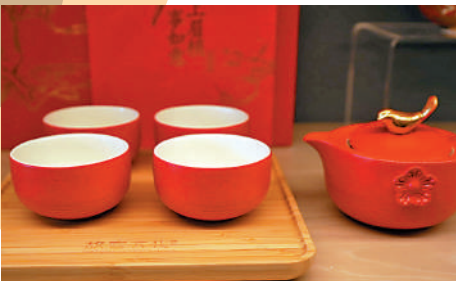
▲禮品店內一款別致的茶具。

搜羅逾二千款來自世界各地與故宮博物院及展覽相關的特色精品、紀念品及書籍，引領訪客穿梭古今，探索知識的寶藏。