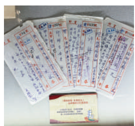
▲20世紀80年代，外洋如鳳寄澄海隆都許錦木的僑批。每一件批款都與年節祭拜有關。