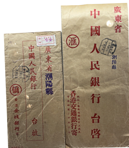
▲20世紀60年代，「香港交通銀行」「香港金城銀行」寄潮陽縣的僑匯單據總包。可見當時僑批運輸路徑是由香港寄深圳寶安轉汕頭再轉潮陽。

「信」的習慣叫法。筆者母語是潮州話，與閩南話同源，但讀不出「信」和「批」兩個字有相近之處，而且信從言，批從手，沒有關連。請教方言專家林倫倫教授，他說出另一個版本：有人說詞源是西班牙語的post，印尼的福建人先翻譯為「批」。總之這裏面有學問。國學大師饒宗頤教授生前非常重視僑批文化，題寫「海邦剩馥、媲美徽學」八字，把僑批文化中誠信的意義和徽商的契約精神相提並論，海外寄批一諾