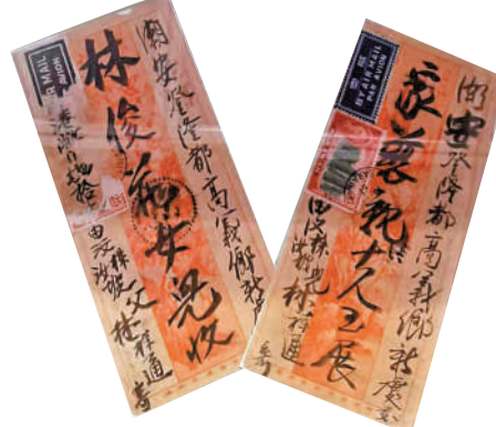
▲20世紀50年代，馬來西亞砂撈越寄往潮安登隆都高義鄉的僑批。這是兩件暗批，即把批款金額用郵票遮蓋。

千金，從未聽聞寄僑批出現失誤，這種無形的合約精神，是中華民族寶貴的精神財富。在科技進步日新月異、百業競爭激烈的今天，但如何繼承和發揚這種文化傳統，是一個非常值得思考的現實問題。