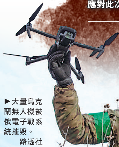
▶大量烏克蘭無人機被俄電子戰系統摧毀。