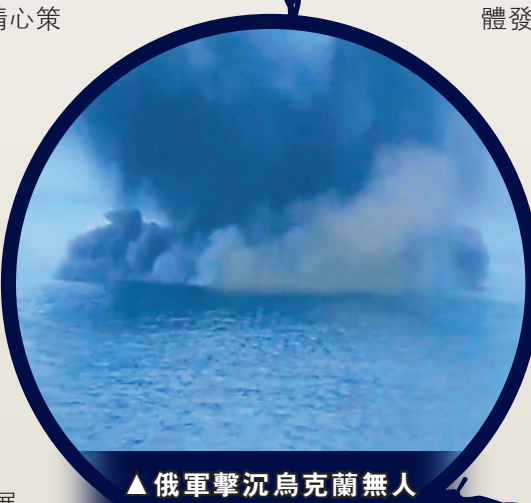
▲俄軍擊落烏克蘭無人艇。

【大公報訊】據美聯社報道：俄羅斯僱傭兵組織瓦格納的負責人普里戈津25日稱，已經開始將烏東巴赫穆特的陣地轉移給俄羅斯正規軍。普里戈津早前表示，巴赫穆特戰役中有2萬瓦格納士兵陣亡。