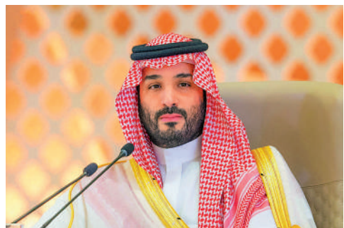
▲沙特王儲（圖）與加拿大總理去年曾在曼谷會議中對話。

【大公報訊】據法新社報道：加拿大和沙特阿拉伯外交部24日分別宣布，兩國將全面恢復中斷了五年的外交關係。