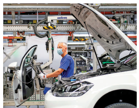
▲德國今年首季汽車銷量下降，圖為德國大眾汽車裝配線。

德國統計局表示，德國今年首季的經濟表現受家庭消費減少拖累，通脹高企令家庭消費收緊，經季節性調整後，首季家庭消費按季下降1.2%。家庭在食品、飲料、鞋類及傢具上的支出都低於上一季