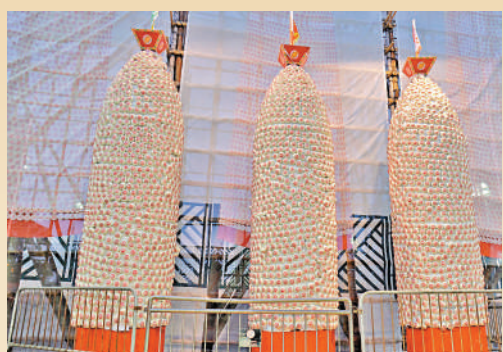
▲今年三座用作祭祀的巨型大包山改為掛畫代替，現場只會設置三座小包山。