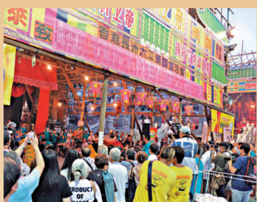
▲昨晚北帝廟前的戲棚，已開始進行舞麒麟活動，大批市民圍着觀賞拍照。