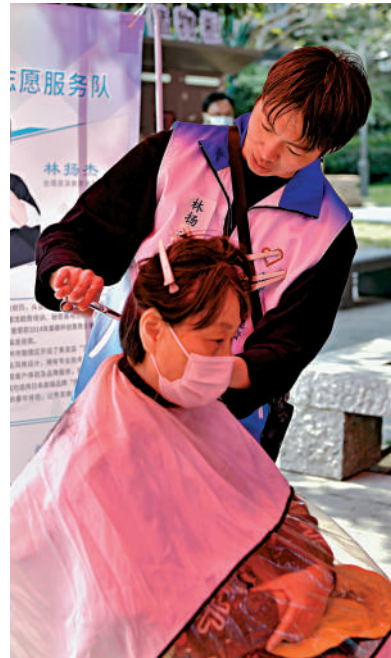
▲林揚傑為福州市民義理髮。