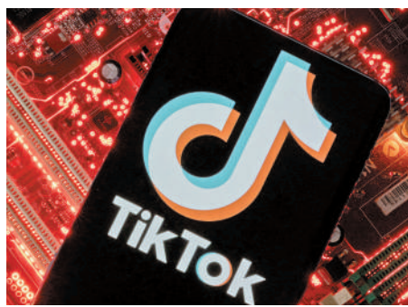
▲ 字節跳動旗下TikTok測試生成式AI聊天機器人，可與用戶交流。

推廣算法，認為其向青少年提供大量有害內容和減肥影片。TikTok回應指出，承諾調整算法。