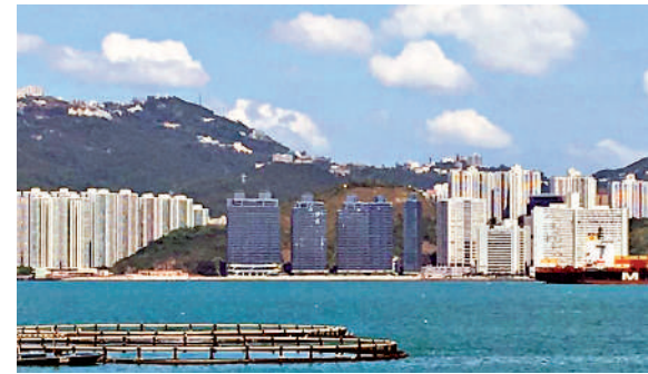
鴨洲豪宅盤凱玥（圖中深色樓盤）。

至於最新主力推銷大埔樓盤中小型單位錄得理想銷售的新地（00016），昨日公布天水圍Wetland Seasons Bay第2期的新銷售安排，推出別墅RV2的1至2樓A及C室，和3樓A及B室共6個單位，於下周二起以招標方式出售，該批3至4房單位的實用面積由757至909方呎不等。