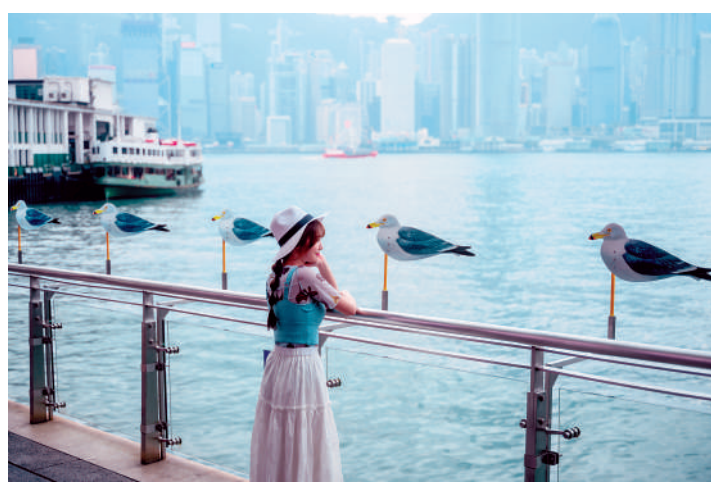
▲「海鷗の港」藝術裝置吸引人打卡。

「海鷗の港」是木村崇人的經典「風向儀系列」的新作品，它不單是一件公共藝術裝置，亦是一個讓市民與大自然互動的裝置。他分享道，「風向儀系列」的設計靈感來自他偶然遇見的海鷗群，當時牠們整齊地排列在岸邊，但當有海風的轉變，牠們就會一致地改變站立方向，呈現出令人嘖嘖稱奇的大自然景觀。他感嘆海鷗懂得迎面向風來減低阻力，並隨即明白到古人為何會以鳥的形狀為藍本製作風向儀。今次作品中的62隻海鷗立板印有黑尾鷗圖案，正如現實世界的海鷗群般，會隨着海風左右擺動。