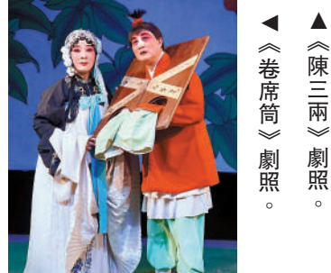
▲《陳三兩》劇照。 ▲《卷席筒》劇照。