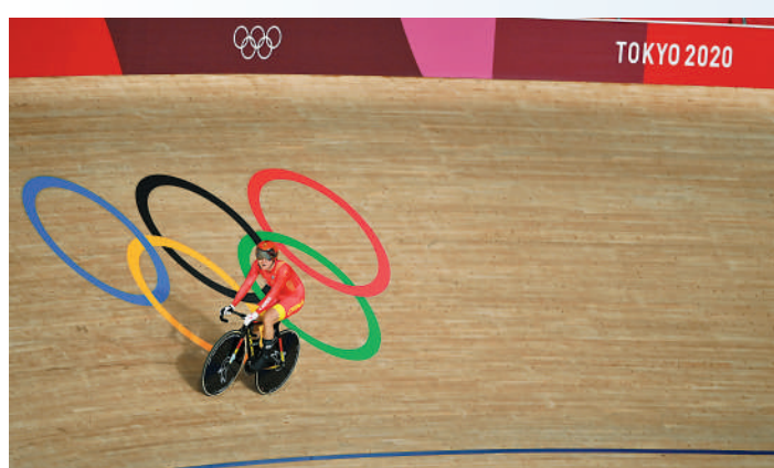
▲鍾天使參與了2021年的東京奧運會。資料圖片