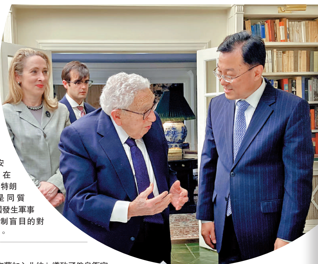
▲ 中國駐美國大使謝鋒26日在康涅狄格州會見基辛格。