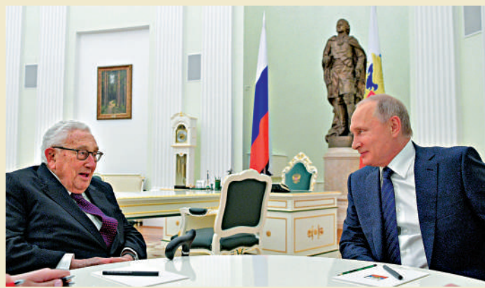
▲ 2017年6月，俄總統普京（右）在克宮會見基辛格。

談及基辛格為何能保持如此旺盛的生命力時，大衛稱，基辛格永遠有無法抑制的好奇心，充滿活力地與世界互動。基辛格近年迷上了人工智能，且筆耕不輟。過去兩年已完成兩本書的寫作，並着手進行第三本新書創作。他去年和麻省理工學院施茨茨曼計算機學院院長哈滕洛德、谷歌前CEO施密特合著了《人工智能時代以及我們人類的未來》一書。