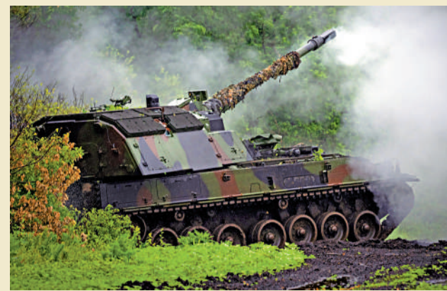
▲ 俄烏衝突持續超過15個月。