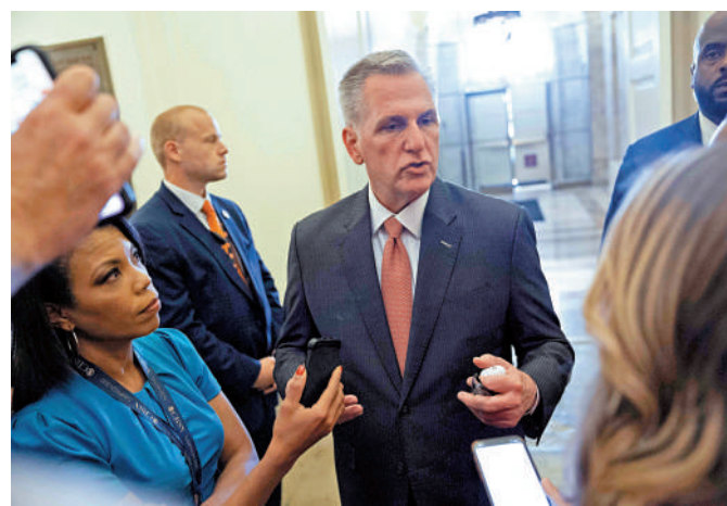
▲ 美國眾議院議長麥卡錫（中）25日在國會見記者。

不過，共和黨人堅持要求申請聯邦食品福利和醫療補助計劃的人必須證明自己正在工作或正在找工作，這將在10年內節省1200億美元的政府開支；但民主黨人稱，這只會將原本符合條件的人排除在外。