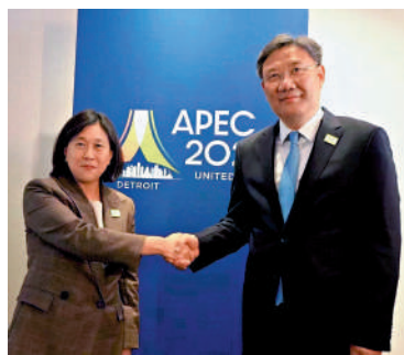
5月26日，商務部部長王文濤會見美國貿易代表戴琪。