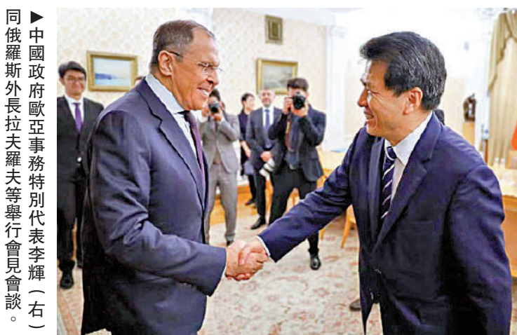
▲中國政府歐亞事務特別代表李輝(右)與俄羅斯外長拉夫羅夫(左)舉行會談。