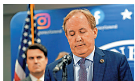
▲得州檢察長帕克斯頓被州議會彈劾。

帕克斯頓在被彈劾前已因保羅一事受到聯邦調查局（FBI）調查，還面臨證券欺詐指控。得州共和黨此前對這些指控持緘默態度，但本周包括得州眾議院議長費倫在內的60名共和黨人投票支持彈劾。帕克斯頓否認所有指控，並批評彈劾是「出於政治動機的騙局」。