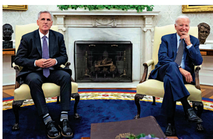
▲拜登（右）和麥卡錫就債務上限達成初步協議，圖為兩人22日就此議題面談。

拜登和麥卡錫27日通電話90分鐘，隨後分別宣布已就政府債務限和預算問題達成初步一致，預計28日完成立法文本並提交給國會。眾議院將於31日進行投票，若協議通過，將提交參議院進行表決。拜登稱，這是向前邁出的重要一步，代表了雙方的妥