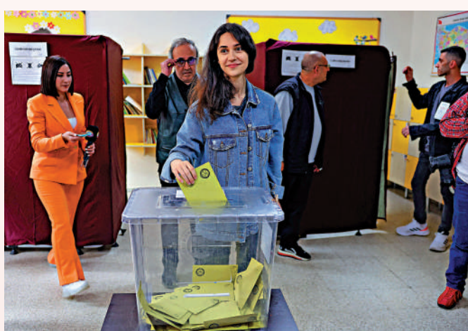
▲土耳其選民28日在安卡拉投票。

埃爾多安童年時期生活在伊斯坦布爾一個工薪階層社區，這裏的很多居民是他的堅定支持者。65歲的出租車司機埃格說，埃爾多安勤奮且聰慧，此次選舉將在土耳其全國贏得60%選票，「但在這裏，他的得票