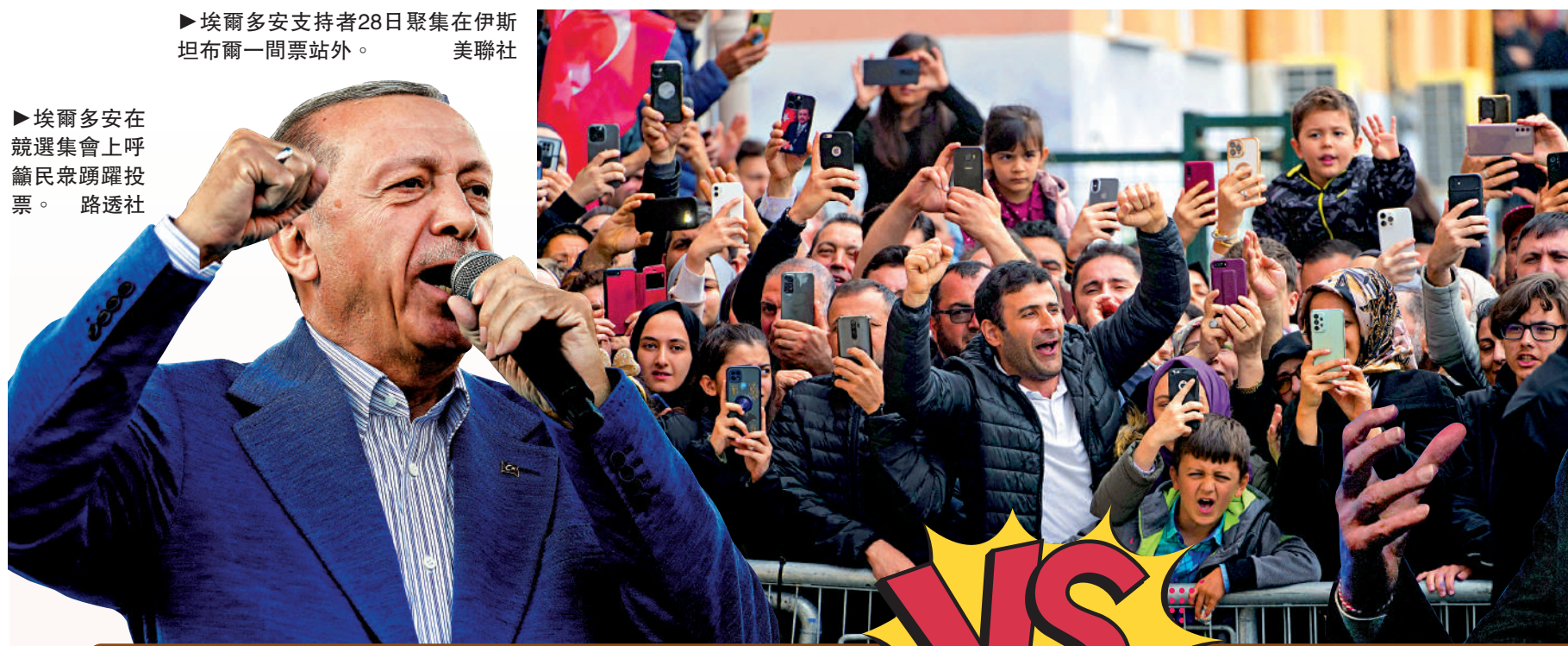
▶埃爾多安在競選集會上呼籲民眾踴躍投票。